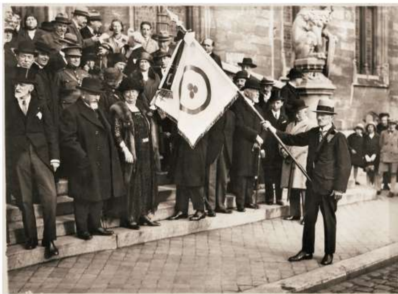
Рис. 3. Участники Первой международной конференции, посвященной Пакту Рериха, на улице Брюгге со Знаменем Мира, украшенном лентами символизирующими цвета Брюгге. Сентябрь 1931 г.