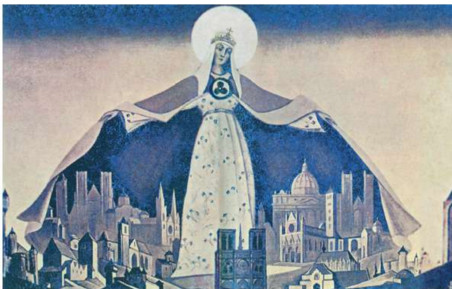
Рис. 6. Н.К. Рерих. Мадонна Защитница. 1933 г. Мадонна Защитница (Святая покровительница)