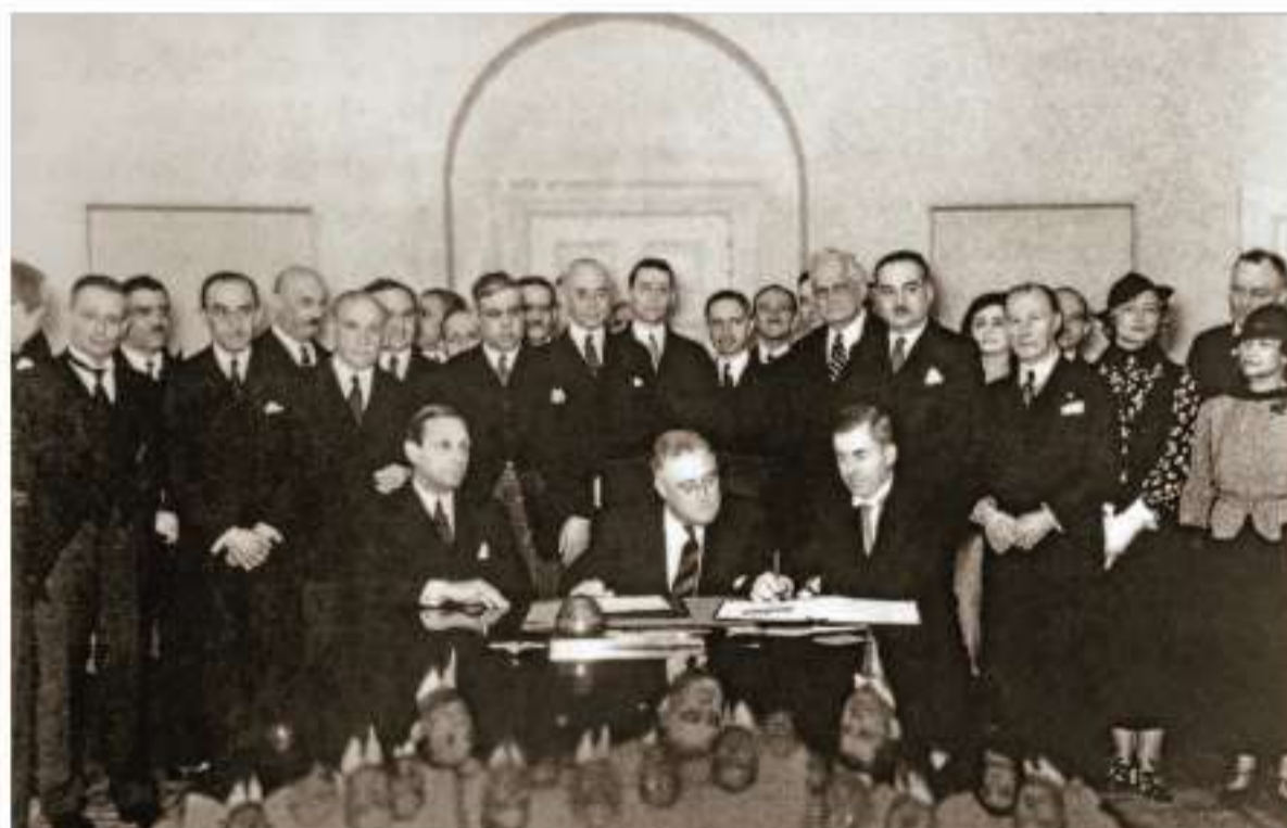
Рис. 4. Церемония подписания Пакта Рериха в Овальном кабинете Белого Дома в присутствии президента США Ф. Рузвельта. Вашингтон. 15 апреля 1935 г.