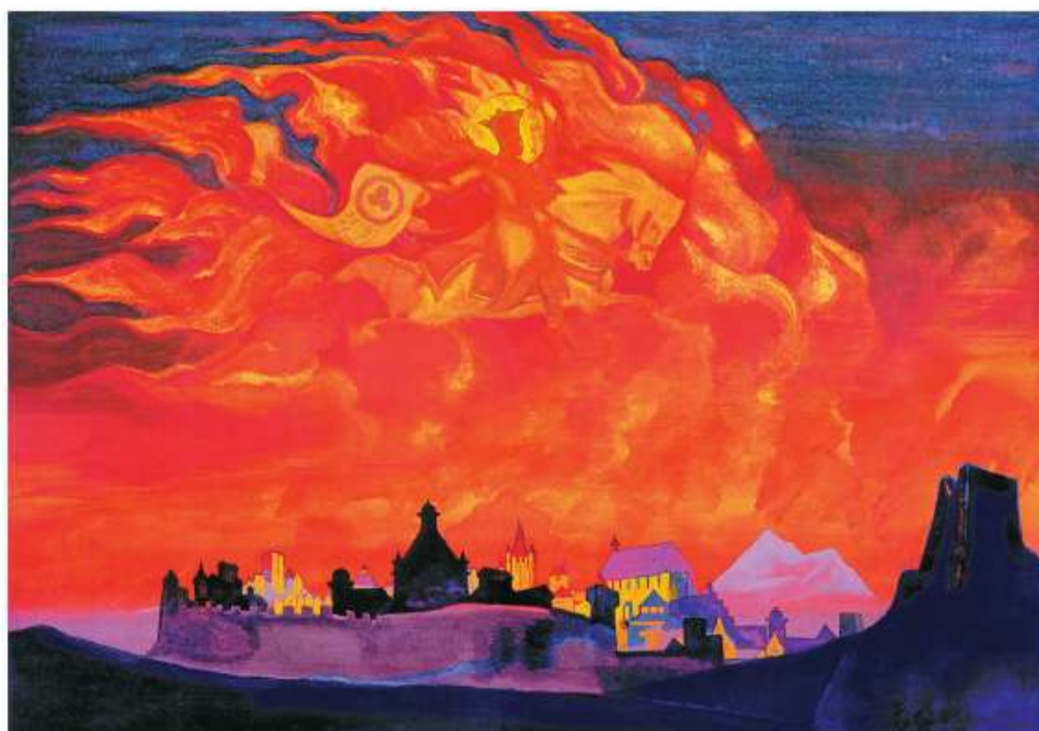
Рис. 7. Н.К. Рерих. София-Премудрость (Знамя Мира). 1932 г.