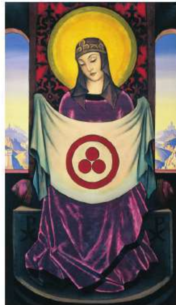
Рис. 5. Н.К. Рерих Мадонна Орифламма, 1932 Pic. 5. N. Roerich Madonna Oriflamma, 1932