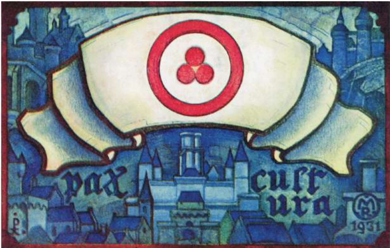
Рис. 1. Н.К. Рерих. Знамя Мира, 1931 Pic. 1. N. Roerich. Banner of Peace, 1931